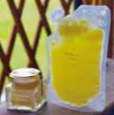
『完熟ゆず果汁』(右)は ビジネスクラスで、 『柚子こしょう』(左)は ファーストクラスの料理で使用